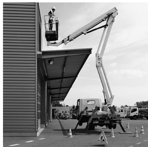
4 Der Arbeitsplatz ist so abzusichern, dass Passanten nicht in den Gefahrenbereich der Hubarbeitsbühne treten.

In Pausen oder nach Arbeitsende ist der Schlüssel der Hubarbeitsbühne abzunehmen und sicher aufzubewahren. So kann die Hubarbeitsbühne nicht von Unbefugten benutzt werden.