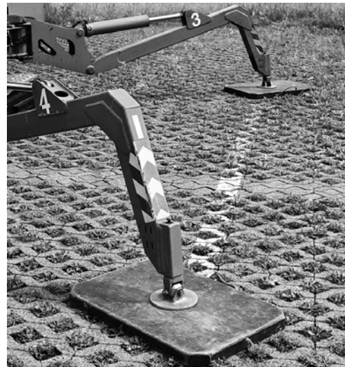
2 Hubarbeitsbühnen mit Stützen müssen auf unbefestigten Böden auf Unterlegplatten abgestützt werden.