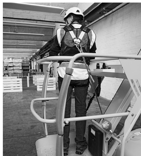
5 Achtung: Beim Verwenden des Rückhaltesystems nur die zugelassenen Anschlagpunkte benutzen und Verbindungsmittel möglichst kurz halten (Betriebsanleitung beachten).

Bei älteren Bühnen ohne entsprechende Anschlagpunkte: Verbindungsmittel mit einer Bandschlinge an einem tragfähigen Bauteil im unteren Bereich des Arbeitskorbes anschlagen. Im Zweifelsfall Fachperson (z. B. Bühnenlieferant) beiziehen