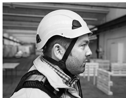
6 Schutzhelm mit Kinnriemen tragen.

Bei älteren Bühnen ohne entsprechende Anschlagpunkte: Verbindungsmittel mit einer Bandschlinge an einem tragfähigen Bauteil im unteren Bereich des Arbeitskorbes anschlagen. Im Zweifelsfall Fachperson (z. B. Bühnenlieferant) beiziehen